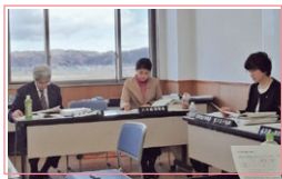
教育福祉常任委員会