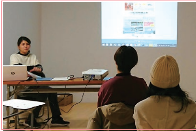
エリミーティング