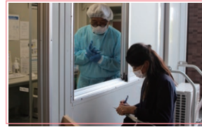
発熱外来現地調査