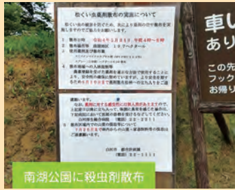
南湖公園に殺虫剤散布

薬剤(殺虫剤)空中散布は人体やミツバチ等に影響を及ぼす可能性があります。これからも人体や環境に対するリスクのないやり方ができないか調査していきます!